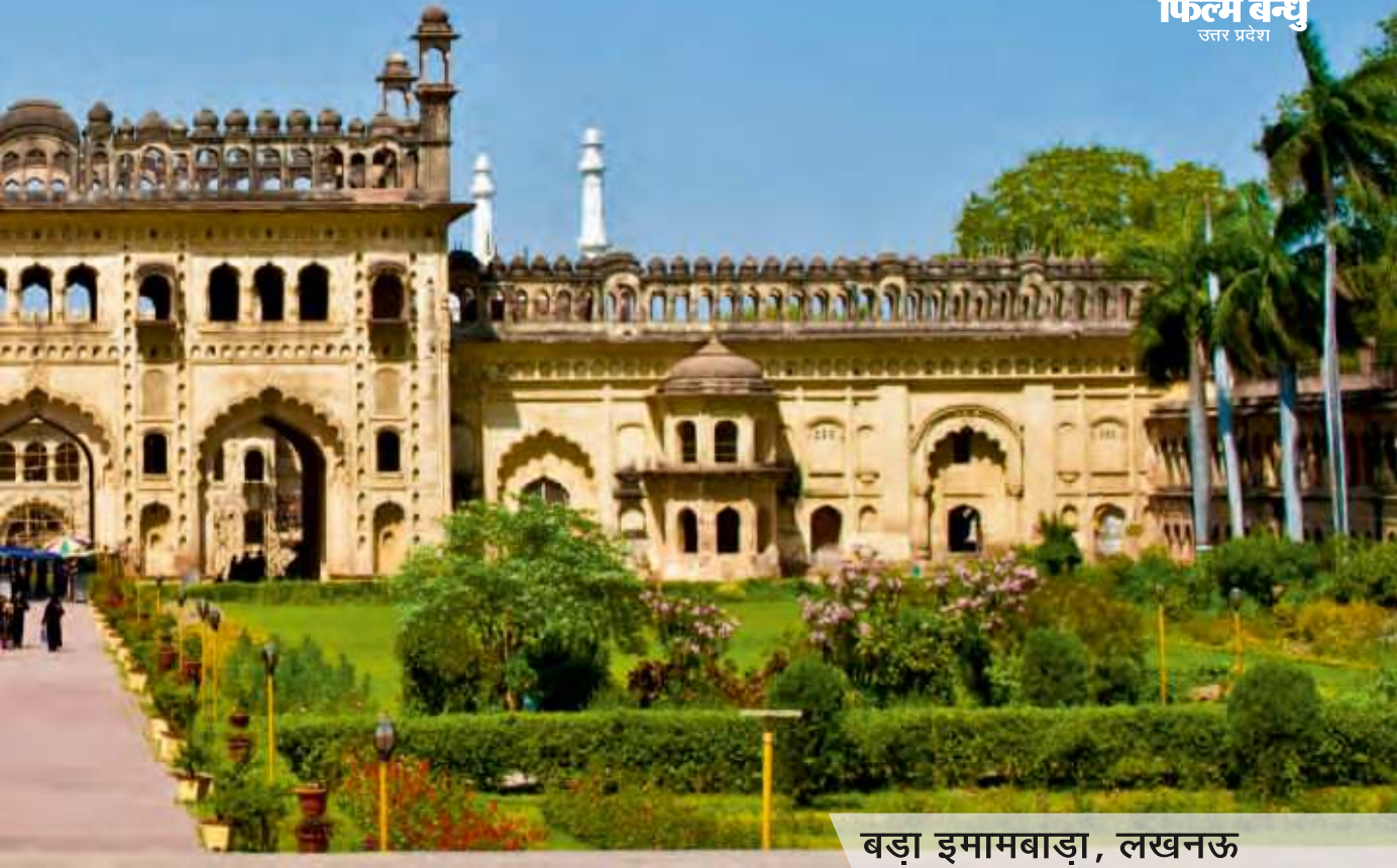
बड़ा इमामबाड़ा, लखनऊ