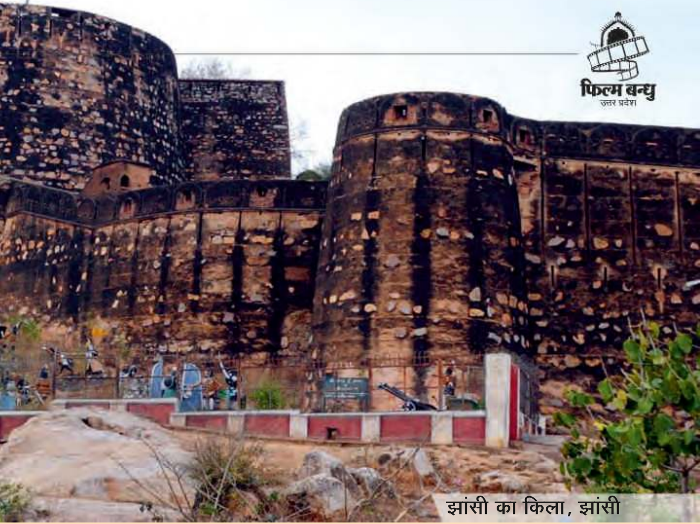
झांसी का किला, झांसी