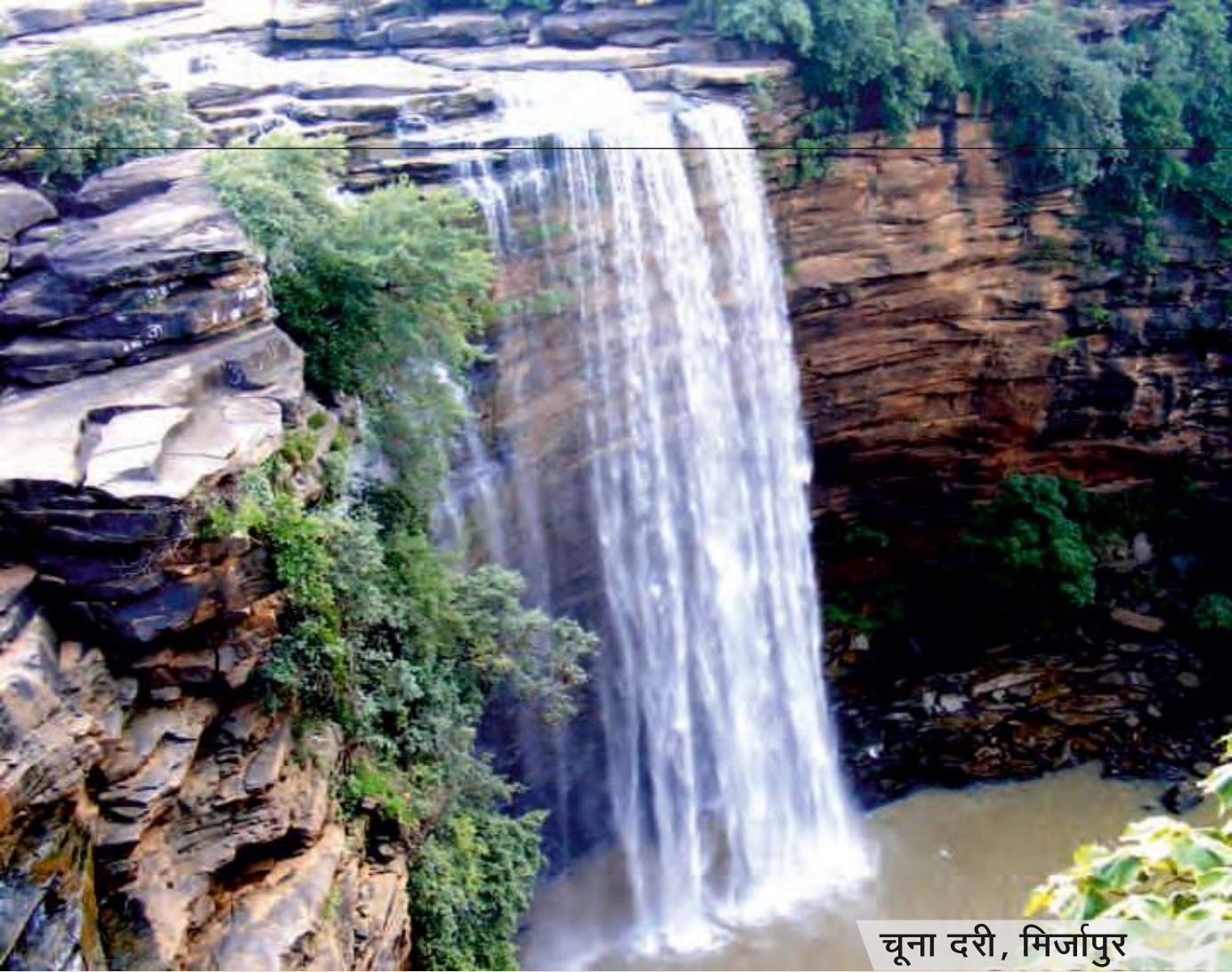
चूना दरी, मिर्जापुर

– संयोजक / नोडल अधिकारी यह समिति फिल्म निर्माताओं द्वारा फिल्म की शूटिंग के लिए प्रार्थना पत्र प्रस्तुत करने पर शूटिंग स्थल की अनुमति, फिल्म यूनिट की सुरक्षा व्यवस्था, नियमानुसार भुगतान करने पर शासकीय गेस्ट हाउस / पर्यटन अतिथि में ठहरने की व्यवस्था तथा शूटिंग के बाद शूटिंग के दिवसों में जिलाधिकारी कार्यालय में प्रदान किये जाने वाले प्रमाण-पत्र के समयबद्ध निर्गमन आदि का अनुश्रवण करेगी तथा जनपद में विभागों के स्तर पर आने वाली कठिनाइयों का त्वरित निराकरण करायेगी। फिल्म शूटिंग से सम्बन्धित आवेदन प्राप्त होने के 15 दिन के अन्दर फिल्म प्रमोशन एण्ड फेसिलिटेशन कमेटी की बैठक आयोजित कर नियमानुसार अपेक्षित कार्यवाही सुनिश्चित की जायेगी।