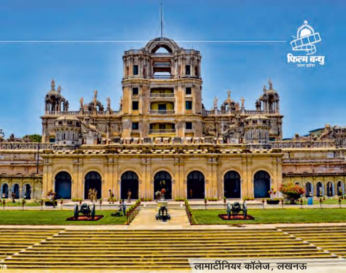
लामार्टीनियर कॉलेज, लखनऊ