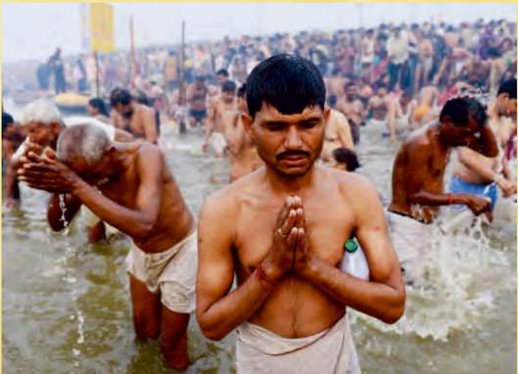
कुम्भ मेला, इलाहाबाद