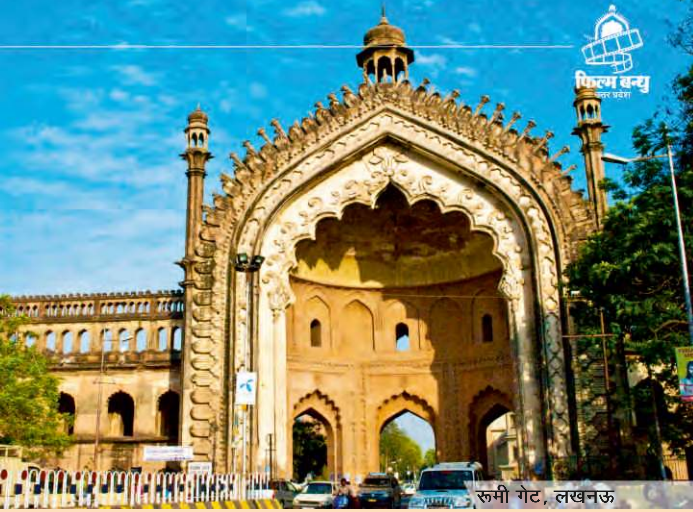
रूमी गेट, लखनऊ

5.3.1.2 प्रदेश में उपलब्ध संभावनाओं का पूर्ण दोहन सुनिश्चित करने के लिए विशेषज्ञ एजेन्सी के माध्यम से एक सम्भाव्यता अध्ययन कराया जाएगा। इस अध्ययन का मुख्य उद्देश्य निजी क्षेत्र में नवीन फिल्म नगरी / नगरियों / फिल्म लैबोरेटरी की स्थापना के लिए सम्भावनाओं का मूल्यांकन करना होगा। यह अध्ययन 'फिल्म बन्धु' द्वारा कराया जाएगा तथा इसकी रिपोर्ट के आधार पर एक विस्तृत परियोजना रिपोर्ट तैयार कर उसे क्रियान्वयन हेतु निजी क्षेत्रों को प्रस्तुत किया जायेगा। प्रत्येक कैलेण्डर वर्ष के लिए भी विस्तृत कार्य योजना बनायी जायेगी।