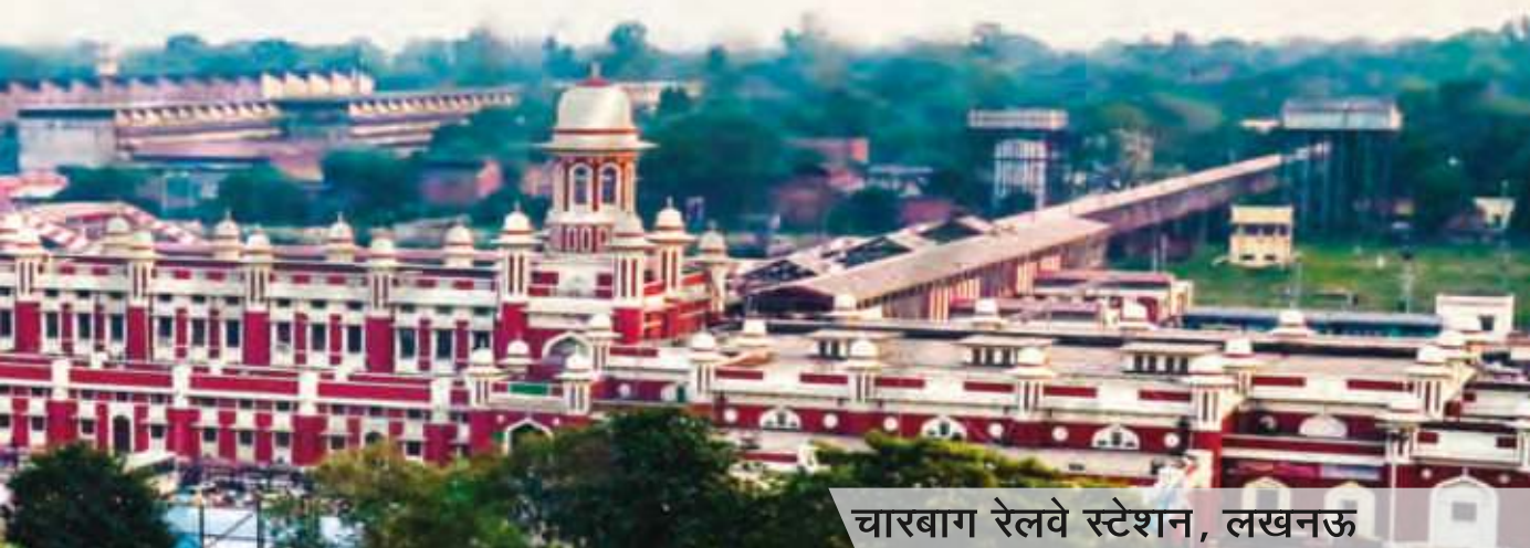
चारबाग रेलवे स्टेशन, लखनऊ