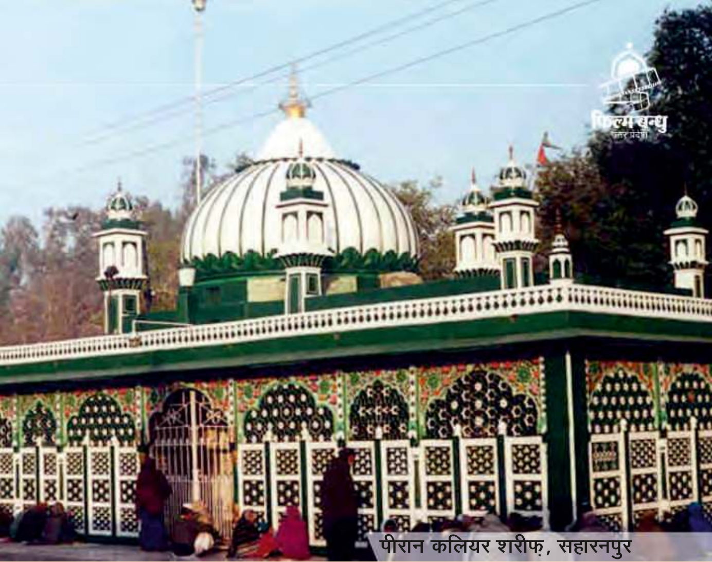
पीरान कलियर शरीफ़, सहारनपुर

प्रदेश में दिनांक 01.07.2017 से माल और सेवाकर अधिनियम, 2017 के क्रियान्वयन हो जाने के उपरान्त, उपरोक्त प्रस्तर-8 के अनुसार, शासनादेश संख्या- 564/ 11 -6-2017-एम(34)/17 दिनांक 28.07.2017 द्वारा प्रदेश में बन्द सिनेमाघरों को पुनः संचालित कराने, संचालित सिनेमाघरों को पुनर्निर्माण/रिमॉडल कराने, मल्टीप्लेक्स विहीन 58 जनपदों में यथाशीघ्र मल्टीप्लेक्स खुलवाने, एकल सिनेमाघरों के निर्माण को प्रोत्साहित करने एवं संचालित सिनेमाघरों के उच्चीकरण हेतु समेकित प्रोत्साहन योजना निर्गत की गयी है।