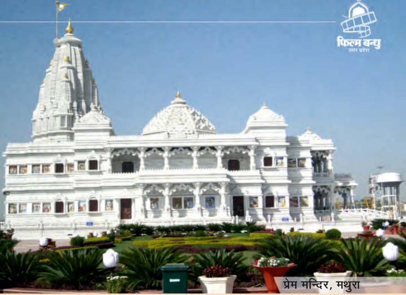
प्रेम मन्दिर, मथुरा

इस उच्चीकरण का लाभ एकल स्क्रीन छविगृह के व्यवसायियों को ही अनुमन्य होगा, मल्टीप्लेक्स को उच्चीकरण योजना का लाभ अनुमन्य नहीं होगा।