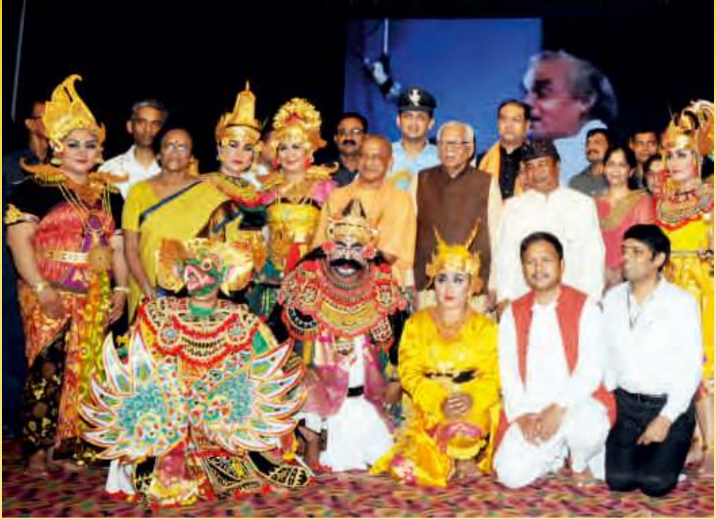
रामलीला में इण्डोनेशिया के कलाकार