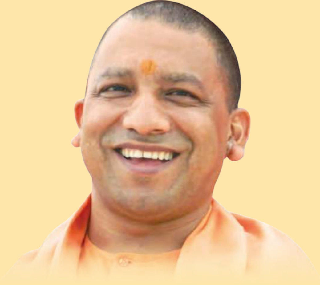
योगी आदित्यनाथ मा. मुख्यमंत्री, उत्तर प्रदेश