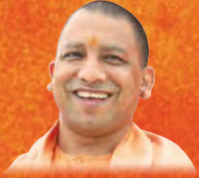
योगी आदित्यनाथ मुख्यमंत्री, उत्तर प्रदेश