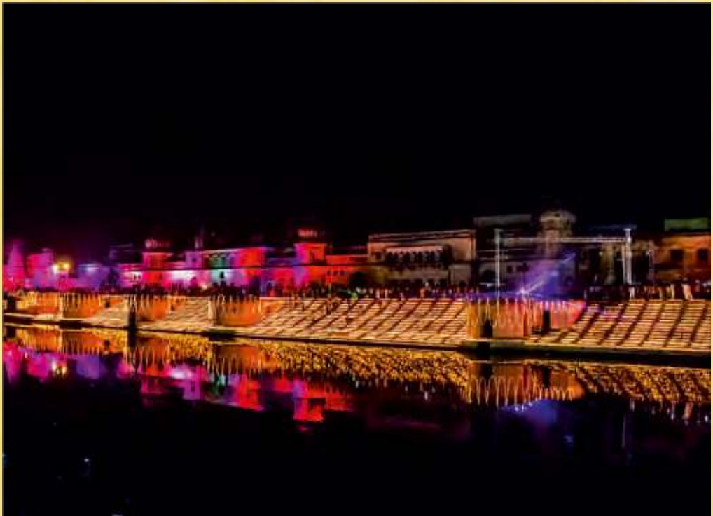
अयोध्या में दीपोत्सव