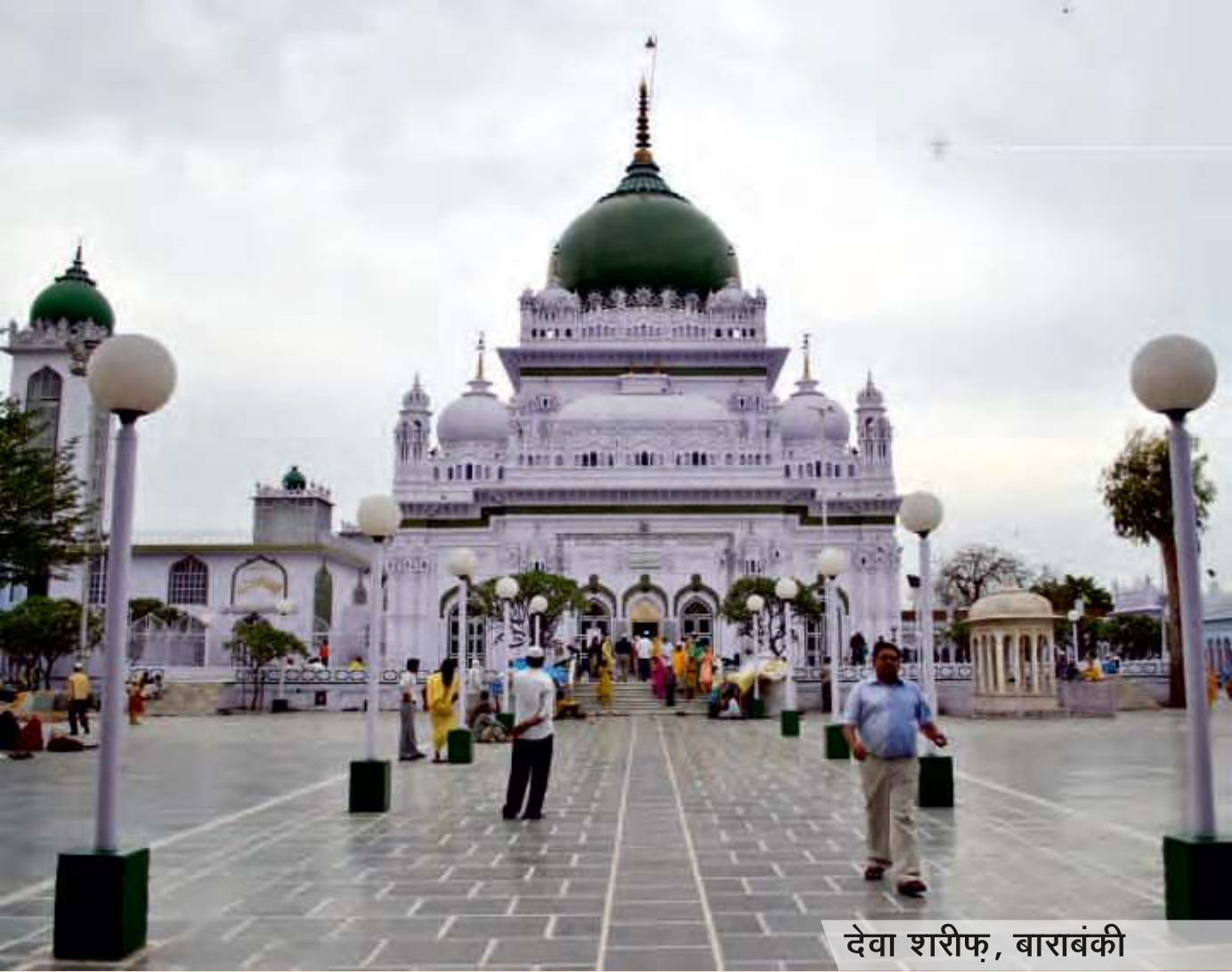
देवा शरीफ, बाराबंकी